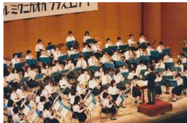
第4回開催時の様子

オールミクニガオカブラスコンサートとは、三国丘高校吹奏楽部（旧ブラスバンド部）のOB・OGが現役吹奏楽部員と協力し、企画・運営・出演全てを行う、一大コンサートイベントです。10ヶ月以上も前から準備される本イベントの当日は、三国丘高校の吹奏楽部元部員が世代を超えて参集し、音楽に浸り、演奏し、語らいます。