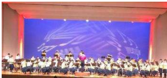
現役生 定期演奏会の様子

このコンサートイベントは、1979年に第1回が開催され、実行委員会のメンバーを入れ替えながら、脈々と引き継がれてまいりました。1995年に第9回が開催されてからはおよそ20年の間、開催されておりましたが、この度、2013年夏、各世代で活動していたOB・OG会が再結集したことをきっかけに、第10回のオールミクニガオカブラスコンサート開催が決定いたしました。